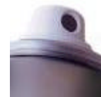
Figure 3 : buse de générateur autonome d'aérosol