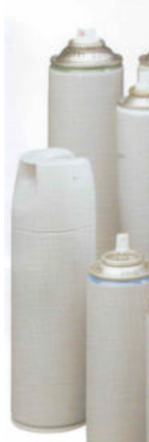
Figure 2 : générateur autonome d'aérosol