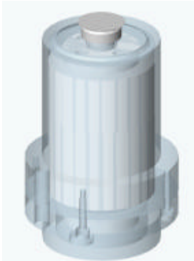
Figure 1 : tête atomisation à disque tournant SPRAI